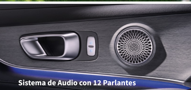
Sistema de Audio con 12 Parlantes