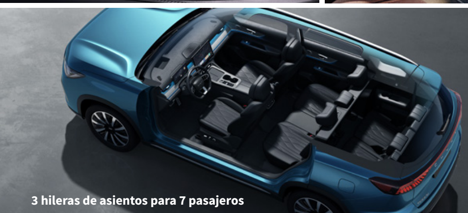
3 hileras de asientos para 7 pasajeros