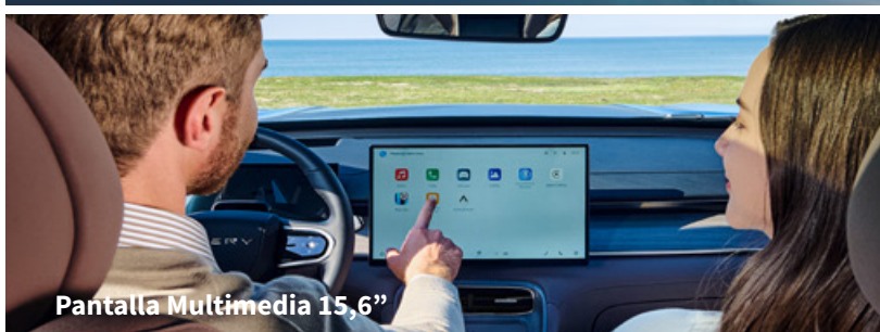
Pantalla Multimedia 15,6"