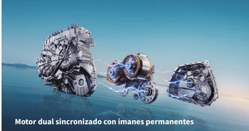
Motor dual sincronizado con imanes permanentes