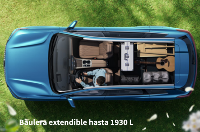
Báulera extendible hasta 1930 L